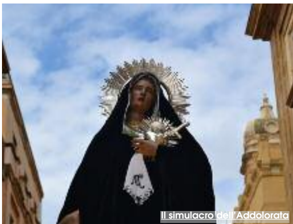
Il simulacro dell'Addolorata

Un video della Processione dei Misteri, realizzato con l'architettura videografica di una sigla, sarà l'apertura di un promo della prossima Settimana Santa a Trapani. I lavori possono essere presentati alla associazione Strada della Passione. In pratica un vero e proprio concorso di idee con l'obiettivo di scegliere, tra quelli pervenuti, un video che dia impulso alla Processione dei Misteri e ai riti del Martedì e Mercoledì Santi divenendo la sigla ufficiale della prossima Settimana Santa. Possono partecipare al concorso tutti i videomaker italiani e stranieri, professionisti e amatoriali che siano già in possesso di immagini video della Settimana Santa trapanese. Unico vincolo che i partecipanti abbiano compiuto la maggiore età. Ogni autore può