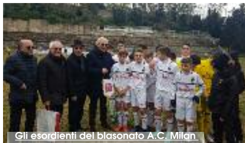
Gli esordienti del blasonato A.C. Milan