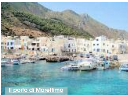
Il porto di Marettimo

È stato avviato dal «Gruppo di Azione Costiera-FLAG Isole di Sicilia» in collaborazione con l'Istituto scolastico autonomo comprensivo «Antonino Rallo» di Favignana il progetto «Warm Welcom English» una strategia di sviluppo locale finanziata dal «Dipartimento della Pesca Mediterranea» della Regione Sicilia. Un progetto che ha l'obiettivo di migliorare la competenza comunicativa in lingua inglese delle categorie che si occupano della gestione dei flussi turistici per questo rivolto principalmente ai pescatori professionisti e ai loro familiari. Per la realizzazione del progetto, sono stati utilizzati i fondi dell'Unione Europea per la pesca. Il corso, si svolgerà presso gli istituti scolastici di Favignana e Marettimo e sarà organizzato in tre moduli di 60 ore. La partecipazione è gratuita. Saranno reclutati un massimo di 20 allievi per modulo. Il bando per il reclutamento degli studenti scade il prossimo 15 gennaio. Gli interessati potranno rivolgersi alla segreteria