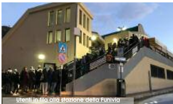
Utenti in fila alla stazione della Funivia

Ad ogni buon conto, in caso di assenza di energia elettrica, l'impianto è dotato di gruppi elettrogeni per il funzionamento dello stesso, al fine di garantire lo svuotamento della linea. Per quanto attiene le oscillazioni avvertite in cabina dall'utente e da coloro che si trovavano nelle cabine in quel momento, FuniErice precisa che queste sono fisiologiche e presenti anche in assenza di vento e per il solo effetto provocato dall'oscilla-