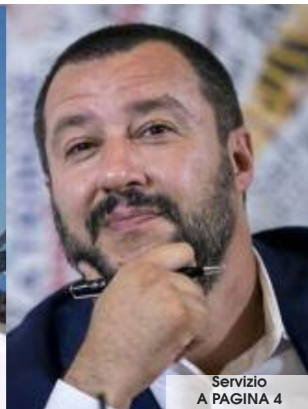
Servizio A PAGINA 4